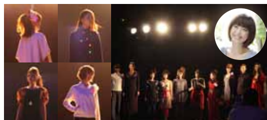
LED エシカル&フェアトレード・ファッションショー