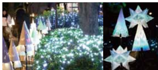
アカリのコンテスト