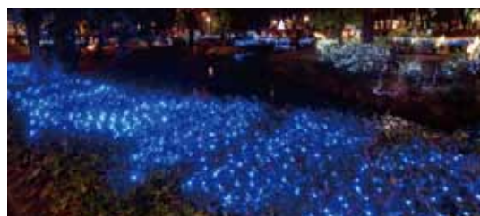
さかえ川イルミネーション